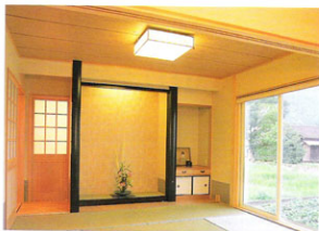
▶【和室】お母さんご夫妻の和室は、ゆったりとした床の寝付き。重厚な感じのする調剤の床材が所感をよく表現する。壁紙は2色で張り分けをして粋に。