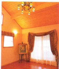
▲【寝室】天井は、屋根の傾斜をそのままにパイン材を使用。木の温もりが心地よく安らぐ。