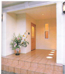
◀【玄関】特殊ガラスを用いた床からの照明がユニーク。テラコッタ風のタイルでお手入れも簡単。

特殊ガラスを用いた床からの照明がユニークなアプローチを通り、玄関へと入る。吹抜の玄関ホール、床はテラコッタ風のタイルが貼られている。照明器具や家具類は、インターネット・オークション等を利用して、購入されたお気に入りのものばかり。キッチンも使い勝手良く整えられている。キッチン奥のストックヤード、各所に設けられた収納など女性ならではの使い勝手を考えられた設計も嬉しい。家の雰囲気を作る壁、天井、建具、家具、調度、カーテン等もMさんご夫妻のこだわりや趣味を反映させながら、フォレストホームのアイデアとセンスでトータルにコーディネート。現場スタッフの技術と実践力で、お気に入りのマイホームが完成した。