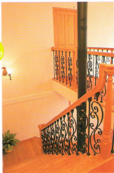
▲【廊下】ストーブの煙突を固くように付けられた階段と廊下。美しい油煙をもちたアイアンの手摺子が豪華。階段の幅もゆったりとしている。

「ゆったり深呼吸できる癒しの家」が希望で、特にリビングの大きな吹き抜けと全面にある窓を中心に素敵な家に仕上げてくださいました。メーカーさんの家創りへのこだわり・仕様・設計強度のこととんのお話いと、信頼できる部分が多かったです。私達の提案も素敵にアレンジして頂き、またメーカーさん側からも斬新なアイデアをどんどん出して頂けて、他にない個性的な家になって大満足です。