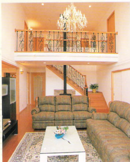
▲【リビングルーム1】西を抜けたゆったりした空間が広がるリビングルーム。上部にある廊下は、海を眺めるために作ったスチージなのだ。シャンデリアはインターネットマークションで購入したこだわりの逸品。