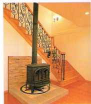
▲【リビングルーム】壁側のアクセントは薪ストーブ。煙突が壁の中を通っているため、これ一台で年中暖かい。フロアリングは、丈夫で美しい厚さ18ミリの杉のムク材を使用。

れた逸品です。そしてこれもそのひとつ」とMさんが示したのは、薪ストーブと御影石で出来た軒台。煙突が部屋の中を通っているため、冬もこれ一つでとても暖かい。家中のサッシは全てペアガラスで遮音断熱効果にも優れ、結露もない。その上、24時間換気システムが設置されている。