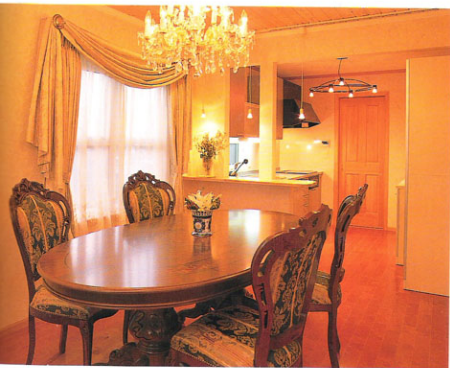
▲【ダイニングルーム】天井はパイン材。モダンなシステムキッチンを選んだお母さんとドアの向こうに設けられたストックヤードは使い勝手に優れている。